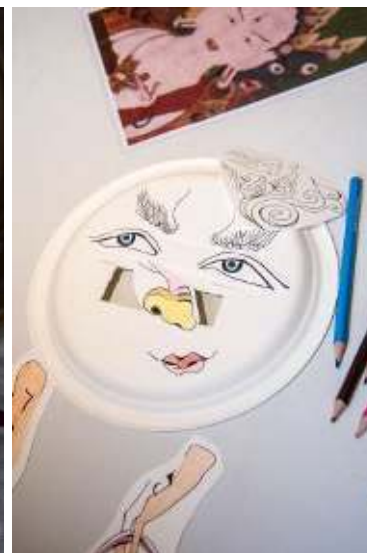
Atelier fabrication de masque tibétain 23 février 2022

Atelier réalisé dans le cadre de l'exposition temporaire « Mandalas et cercles de protection du bouddhisme tibétain »