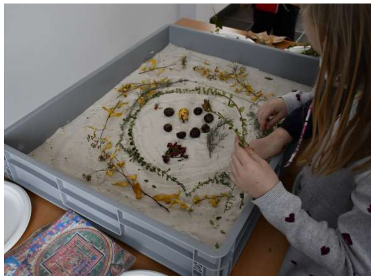
Atelier mandala végétal ALSH le Brusquet, 2021

Atelier réalisé dans le cadre de l'exposition temporaire « Mandalas et cercles de protection du bouddhisme tibétain »