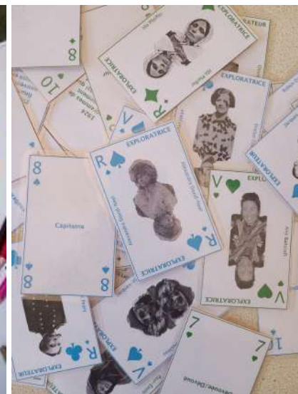
La bataille des exploratrices - Atelier sur l'égalité filles-garçons

Atelier réalisé dans le cadre de l'exposition temporaire « Déesse et femmes du bouddhisme tibétain »