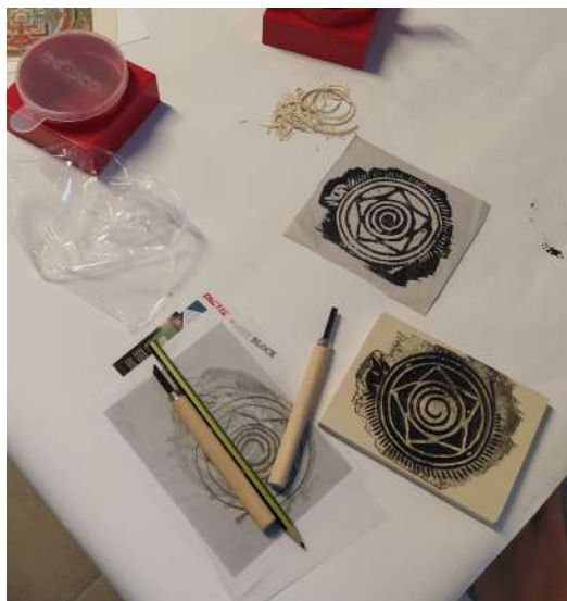
Atelier création de cercles de protection - gravure Journées Européennes du Patrimoine, 2021

Atelier réalisé dans le cadre de l'exposition temporaire « Mandalas et cercles de protection du bouddhisme tibétain »